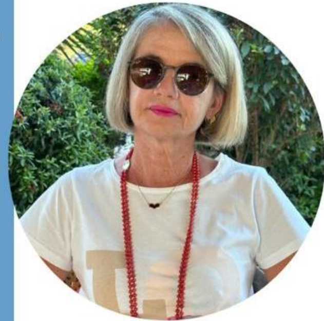
Michela Acconci Scuola Primaria

Ecco il perché della mia candidatura e la scelta di questo Sindacato che ha fatto proprie le lotte per una SCUOLA DEMOCRATICA, LIBERA che sappia dare dignità' alla professione degli insegnanti e che passi anche da una " giusta" riqualificazione economica.