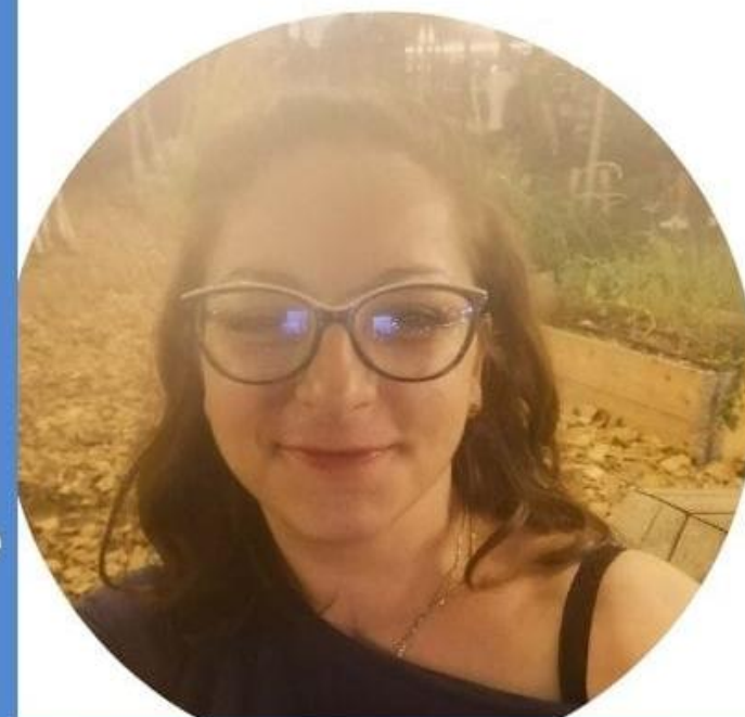
MARIAPINA BALESTRA SCUOLA SECONDARIA DI PRIMO GRADO

È necessario che la scuola riprenda la sua centralità nella società contemporanea e che riacquisti il suo valore. Noi ci impegniamo perché ciò avvenga.