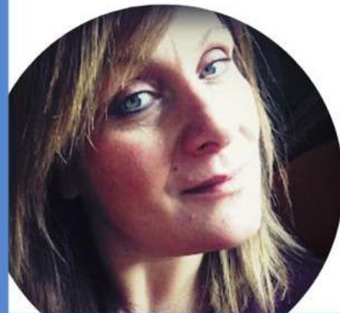
NADIA TAVELLA SCUOLA SECONDARIA DI PRIMO GRADO

Il nostro scopo come lista sarà quello di portare una fotografia attendibile della realtà, e rappresentare al meglio tutto il comparto scuola. Bisogna ridare dignità alla figura docente perché siamo i primi agenti di inclusione sociale ed educativa.