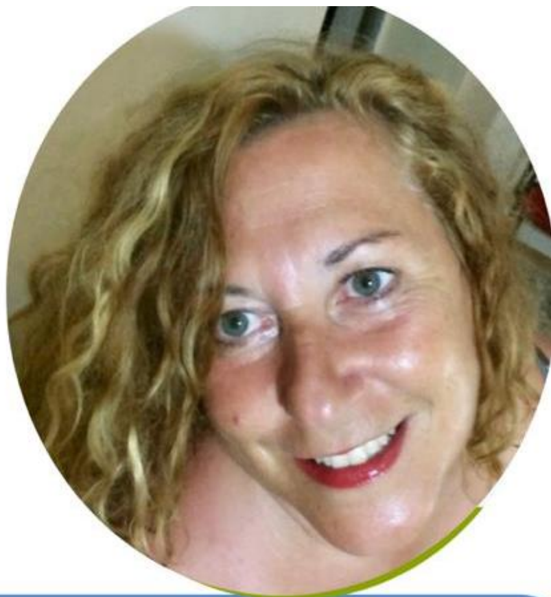
EMILIA MEZZATESTA SCUOLA PRIMARIA

Ho accettato di candidarmi in questa lista perché credo nelle cose umili, ho sempre lottato per il riscatto sociale e la dignità della persona, promuovendone la crescita personale e sociale. Conosco il mondo della scuola paritaria, della scuola pubblica e della cooperazione sociale. Ogni giorno della mia vita dal 1990 l'ho vissuto educando, empatizzando con alunni, colleghi, famiglie, associazioni. Ritengo che la nostra presenza nel mondo del sindacato dei "Grandi" possa fare la differenza. Se sei sfiduciato/a e non ti senti ascoltato/a sappi che tanti docenti sono nella tua stessa condizione. Fai un passo di fiducia, aiutaci a riappropriarci della dignità del ruolo, ormai perso nel tempo.